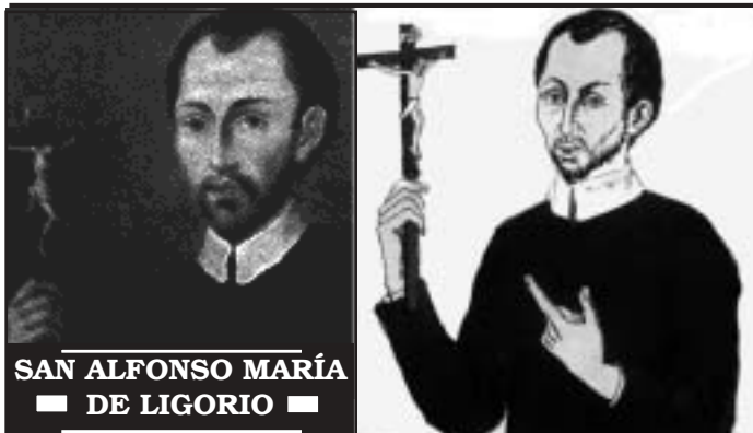
SAN ALFONSO MARÍA DE LIGORIO