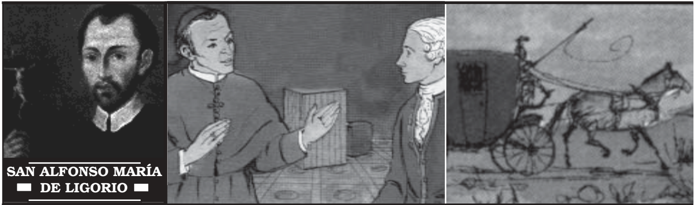
■ SAN ALFONSO MARÍA DE LIGORIO ■

En el palacio del nuevo Obispo, sus servidores le presentaban numerosos regalos de gran valor que le enviaban los nobles y ricos del pueblo. Alfonso ordenó devolver inmediatamente todos los presentes a sus dueños originales, comunicándoles a su vez que el nuevo Obispo no recibirá ningún tipo